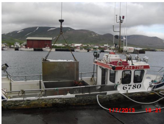
Myndir 4-7. Löndun á Skagaströnd 1. júlí 2013. Þorskur 2,2°C.

Rétt er að minna á að aðeins voru skoðaðar 20 hafnir af þeim u.þ.b. 60, sem við landið eru.