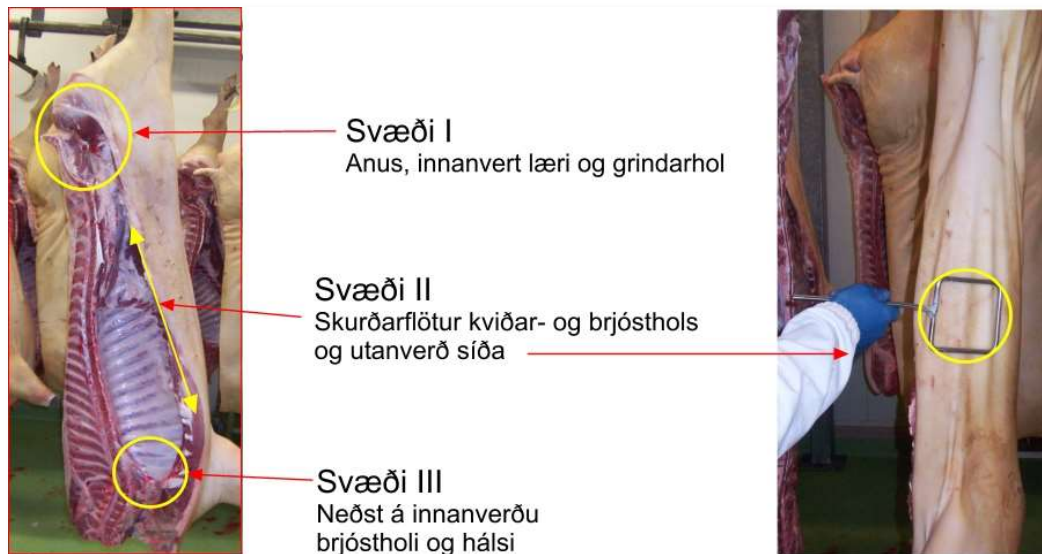
Mynd 3: Mynd af sýnatökusvæðum I – III.

Stroksýni af svínaskrokkum eru rannsökuð í RapidChek prófi á Keldum, Reykjavík eða hjá ProMat, Akureyri.