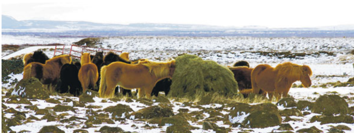
Matvælastofnun sér nú um leyfisveitingar til örmerkingamanna og getur innkallað slík leyfi ef skráning á merkingum skilar sér ekki eins og til er ætlast. Leyfi sem Bændasamtök Íslands hafa áður gefið út gilda áfram en þeir sem ljúka námskeiði í örmerkingum frá og með þessu ári þurfa að sækja um leyfi Matvælastofnunar að námskeiði loknu til að geta keypt örmerki og stundað þessa starfsemi.

Við útflutning hrossa og afurða þeirra er gerð krafa um hestapassa sem samkvæmt Evrópugerð þar að lútandi skal gefinn út á folaldsárinu. Í raun er þetta krafa um að gefinn sé út hestapassi fyrir öll ásetningsfolöld hér á landi. Árið 2010 var staðfest af hálfu Evrópusambandsins að skráning hrossa í gagnagrunninn www.worldfengur.com (WF) jafngilti útgáfu á rafrænum hestapassa fyrir hross hér á landi að uppfylltum ákveðnum skilyrðum: Í landinu þarf að vera opinbert kerfi sem tryggir að öll hross eldri en 10 mánaða séu skráð og örmerkt auk þess sem öll lyfjameðhöndlun skal vera skráð og aðgengileg. Það reynir því ekki bara á skráningu og merkingu á þeim einstaklingum sem flutt eru úr landi úr landi eða fara í sláturhús, allt hestahald landsins þarf að lúta þessum kröfum.